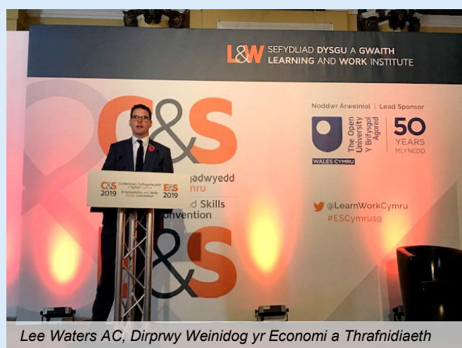
Lee Waters AC, Dirprwy Weinidog yr Economi a Thrafnidiaeth

Roeddem yn falch iawn o gael gwahoddiad i hwyluso gweithdy yng Nghynhadledd Cyflogadwyedd a Sgiliau Cymru a gynhaliwyd gan y Sefydliad Dysgu a Gwaith (LWI). Cynhaliwyd y digwyddiad yn Neuadd y Ddinas, Caerdydd, gydag amrywiaeth ragorol o gyflwyniadau a gweithdai.