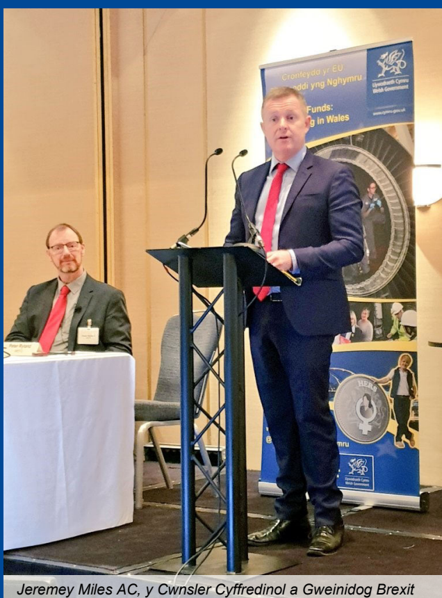
Jeremy Miles AC, y Cwnsler Cyffredinol a Gweinidog Brexit