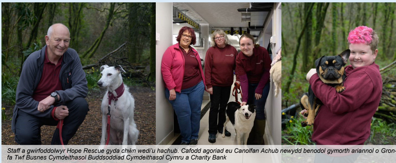
Staff a gwirfoddolwyr Hope Rescue gyda chŵn wedi'u hachub. Cafodd agoriad eu Canolfan Achub newydd benodol gymorth ariannol o Gronfa Twf Busnes Cymdeithasol Buddsoddiad Cymdeithasol Cymru a Charity Bank

Gellir cysylltu â thîm Buddsoddiad Cymdeithasol Cymru ar 0300 111 0124 neu sic@wcva.cymru .