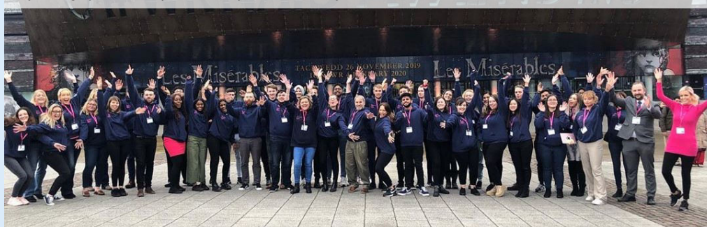
Cyfranogwyr 'Bwtcamp i Fusnes' ym Mae Caerdydd

Mae Syniadau Mawr Cymru yn cael ei gyllido yn rhannol gan Gronfa Datblygu Rhanbarthol Ewrop drwy Lywodraeth Cymru.